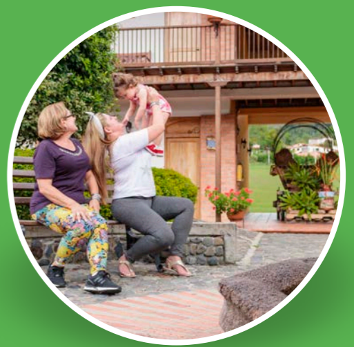
Hotel Hacienda Balandú (Jardín)