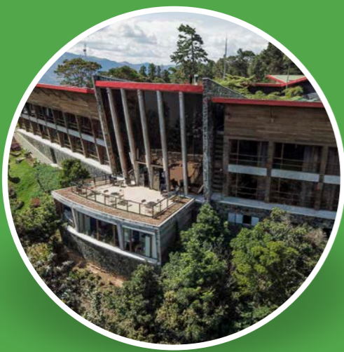
Hotel Piedras Blancas (Santa Elena)

Si eres mayor de 50 años, accede a nuestros hoteles con tarifas preferenciales en plan americano. Incluye: alojamiento una noche dos días, desayuno, almuerzo, cena, uso de instalaciones, zonas húmedas y seguro hotelero.