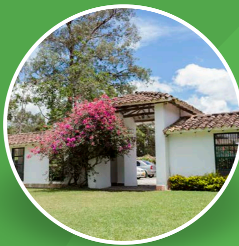
Hotel Recinto Quirama (Carmen de Viboral)