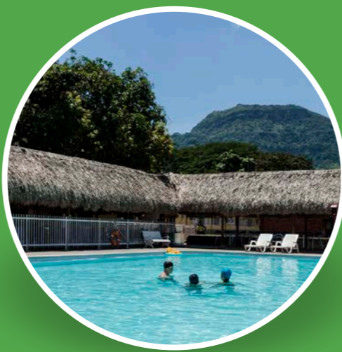
Hostería Farallones (La Pintada)